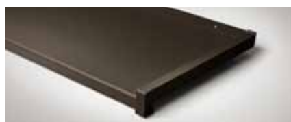
Best.-Nr. C33, Mittelbronze, C34 Dunkelbronze