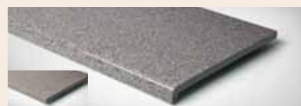
Best.-Nr. 36*, 336* Granit