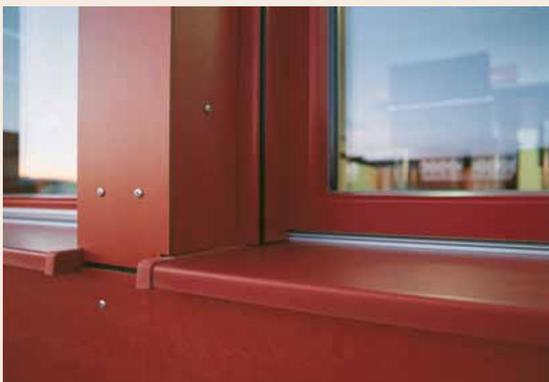
Außenfensterbank puritamo, Farbe Granat