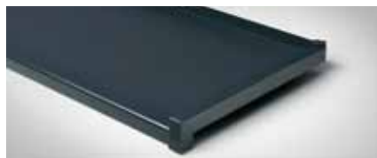
Best.-Nr. 7016 matt, Anthrazitgrau Blende 25 mm Best.-Nr. 7016 glänzend, Anthrazitgrau Blende 40 mm