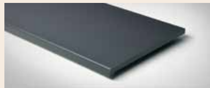
Best.-Nr. 250M Graphit