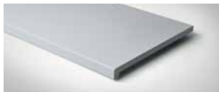
Best.-Nr. 77, NEU Perlgrau