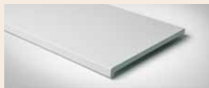
Best.-Nr. 230M Weiß