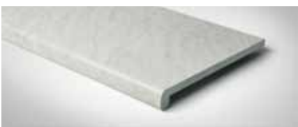
Best.-Nr. 62, Carrara