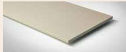
Best.-Nr. 180M Creme