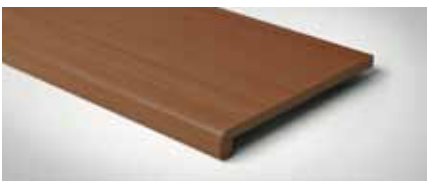
Best.-Nr. 56, Buche