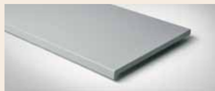
Best.-Nr. 210M Kiesel