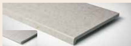
Best.-Nr. 91, 91M, 391, 391M