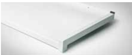
Best.-Nr. 9016, Weiß