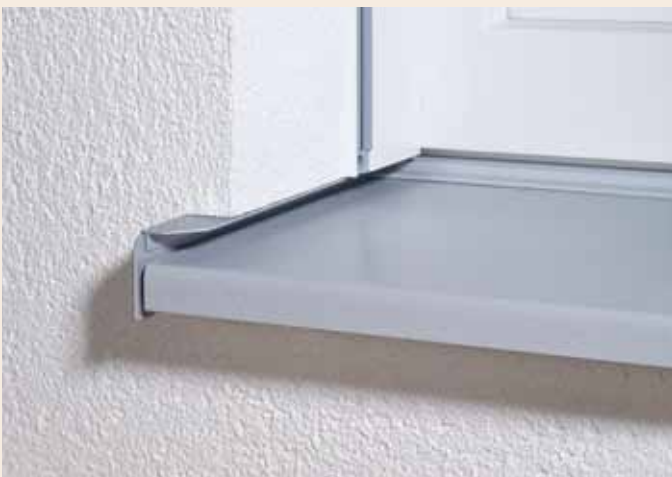
MIT SlidePal U-Abschluss