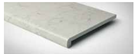
Best.-Nr. 68, Roma *Auslauffarbe