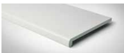
Best.-Nr. 66, Weiß