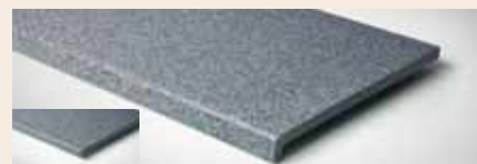
Best.-Nr. 32M, 332 Granit