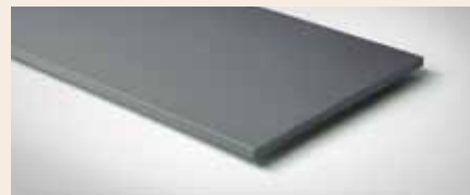
Best.-Nr. 190M Betongrau