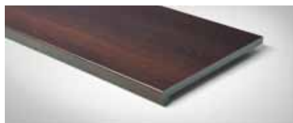
Best.-Nr. 75, Pino