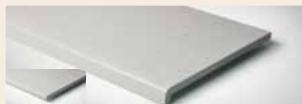
Best.-Nr. 10, 10M, 310

ca. 1 Woche auf alle helopal Produkte. helopal Fensterbänke werden generell mit Schutzfolie geliefert.