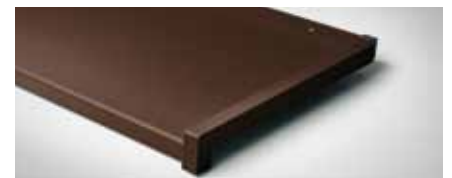
Best.-Nr. 8017M, Schokobraun Matt Blende 25mm