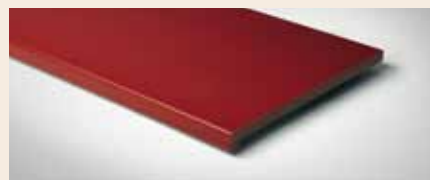
Best.-Nr. 260M Granat, Auslauffarbe

Abgebildete Farbflächen sind nicht farbverbindlich.