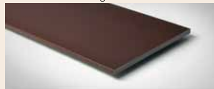
Best.-Nr. 170M Terra