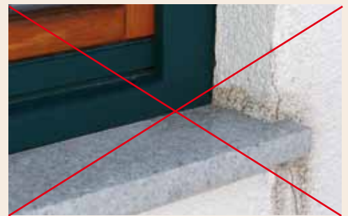
Falsch montierte Fensterbank

Vom Institut für Fenstertechnik Rosenheim und der Holzforschung Austria erfolgreich auf Schlagregendichtheit geprüft.