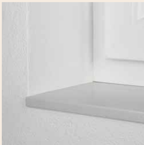
ELEGANT: bündiger Einbau

Der Einbau mit Schattenfuge erfüllt Designansprüche auf höchstem Niveau. Fensterbank und Wand schließen exakt ab. Das Ergebnis ist ein Raumerlebnis von neuer Klarheit und Präzision. Der bündige Einbau sorgt für schlichtes elegantes Wohngefühl. Der Standardeinbau für klassische zeitlose Ansprüche.