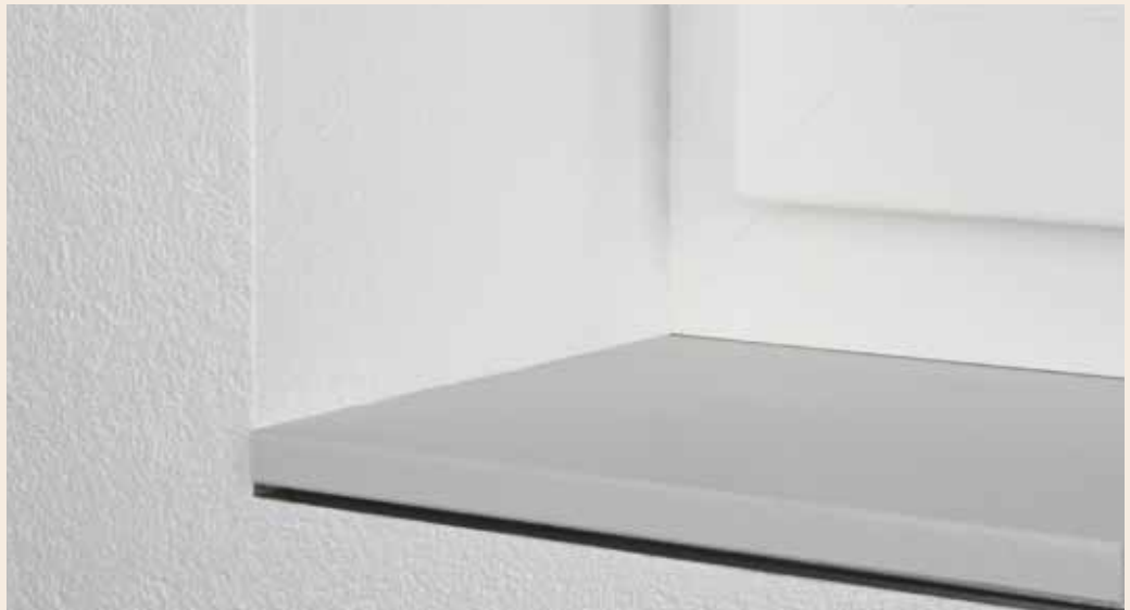
RAFFINIERT UND EDEL: puritamo Innenfensterbank linea, Einbau mit Schattenfuge