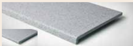
Best.-Nr. 30M, 330MGranit