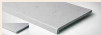
Best.-Nr. 18, 18M, 318, 318M