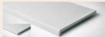
Best.-Nr. 95M, 395M*