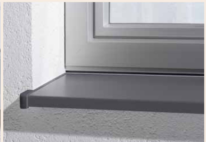
MIT helopal contact Abschluss