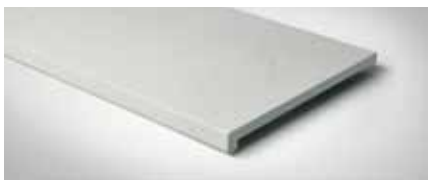
Best.-Nr. 71, Marmor-Bianco