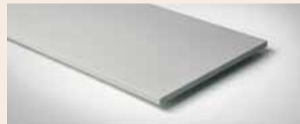
Best.-Nr. 160M Lichtgrau