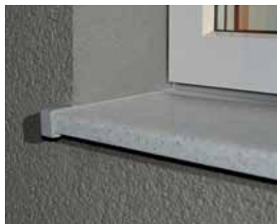
Fensterbank mit helopal contact 3fach-Schutz

helopal contact 3fach-Schutz gewährleistet eine absolut sichere und wasserdichte Verbindung zwischen Mauerwerk, Fassade und Fenster.