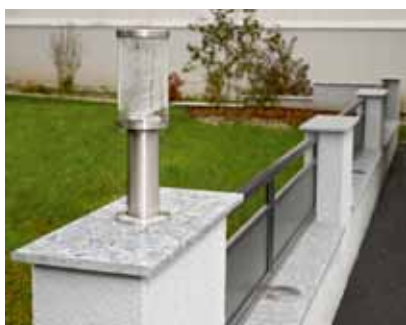
helopal als Mauerabdeckung: langlebig und wetterfest.