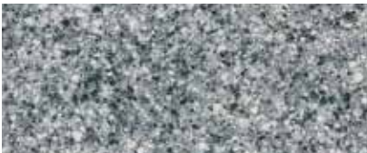
Best.-Nr. 32M, 332M