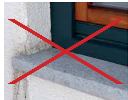
Falsch montierte Fensterbank

Vom Institut für Fenstertechnik Rosenheim erfolgreich auf Schlagregendichtheit nach DIN EN 1027 (Prüfberichtsnummer 32024448) geprüft.