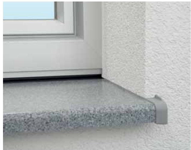
Ausführung exklusiv – die Fensterbank mit 3,2 cm Blende