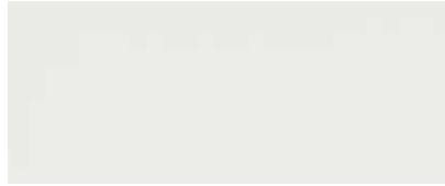
Best.-Nr. 95M, 395M