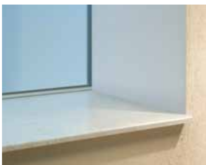
Die helopal Innenfensterbank: ein beständiger Blickfang.

abdeckungen, stabile Austrittsstufen für Terrassen und Balkone, Pooleinfassungen und vieles mehr.