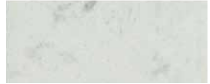
Best.-Nr. 18, 18M, 318, 318M