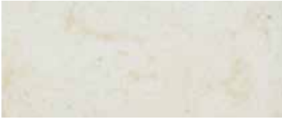
Best.-Nr. 10, 10M, 310