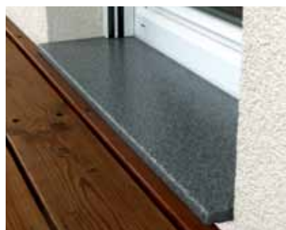
helopal Qualität für Austrittsstufen: formstabil und trittsicher.