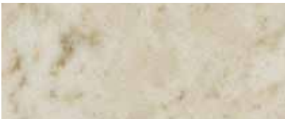
Best.-Nr. 91, 391M