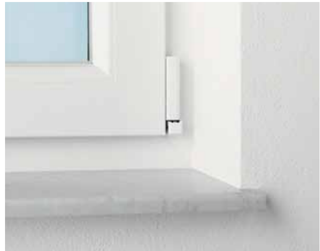
Ausführung classic – 2 cm starke Fensterbank mit schlichtem Design

helopal garantiert eine maximale Liefer- zeit von nur zwei bis fünf Werktagen bei allen Produkten (Ausnahme Sonderan- fertigungen).