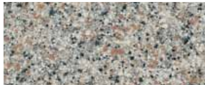
Best.-Nr. 36, 336