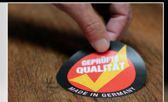
Geprüfte Qualität „made in Germany“

Wir verwenden erstklassige Rohstoffe und arbeiten kontinuierlich an der Optimierung unserer Produktionsprozesse. Bei der Endkontrolle verlassen wir uns ausschließlich auf das geschulte Auge unserer Mitarbeiter.