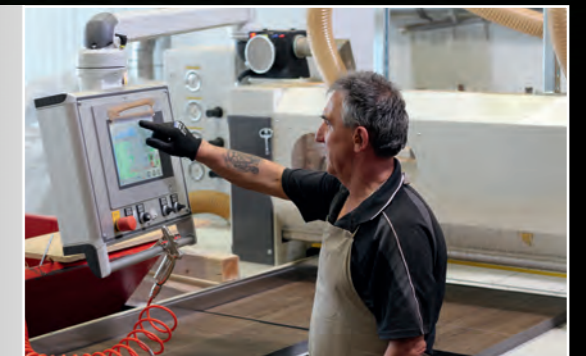
Präzise Schnitte an der Säge

Die Technik arbeitet aber nur deshalb so präzise, weil unsere Mitarbeiter genau wissen, was sie tun.