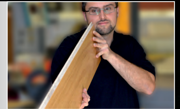
Endkontrolle mit geschultem Blick

Diese handwerklichen Fertigungsprozesse sorgen für langlebige Produkte, die Sie begeistern werden.