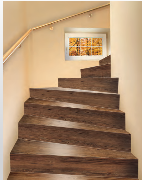
Das Beispiel rechts zeigt die Zusammenstellung der Treppenelemente bei einer innenliegenden Treppe, das heißt bei einer Treppe, die an beiden Seiten von einer Wand begrenzt ist.

Die Treppenelemente werden bündig mit der Treppenmauer verlegt!