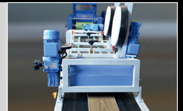
Parkett-Öl-Maschine im Einsatz

Deshalb investieren wir ständig in neue innovative Maschinen und Materialien.