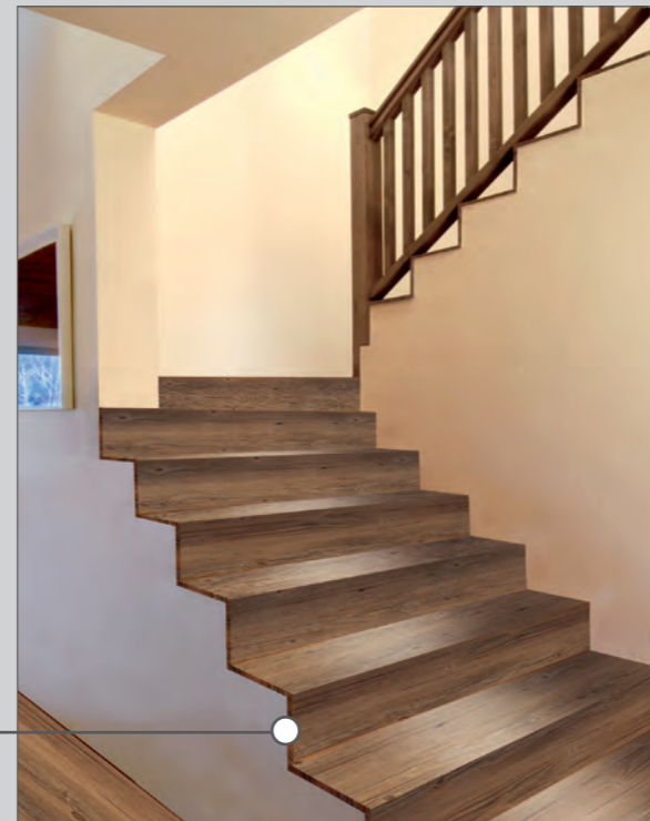
Dieses Beispiel zeigt die Zusammenstellung der Treppenelemente bei einer einseitig freistehenden Treppe, das heißt bei einer Treppe, die nur an einer Seite von einer Wand begrenzt ist.